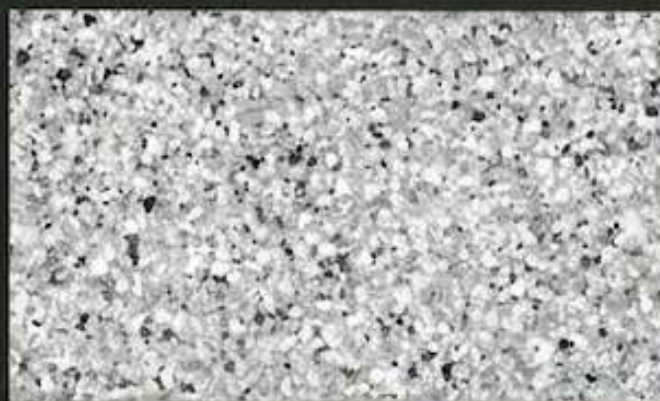
02. Jasny szary